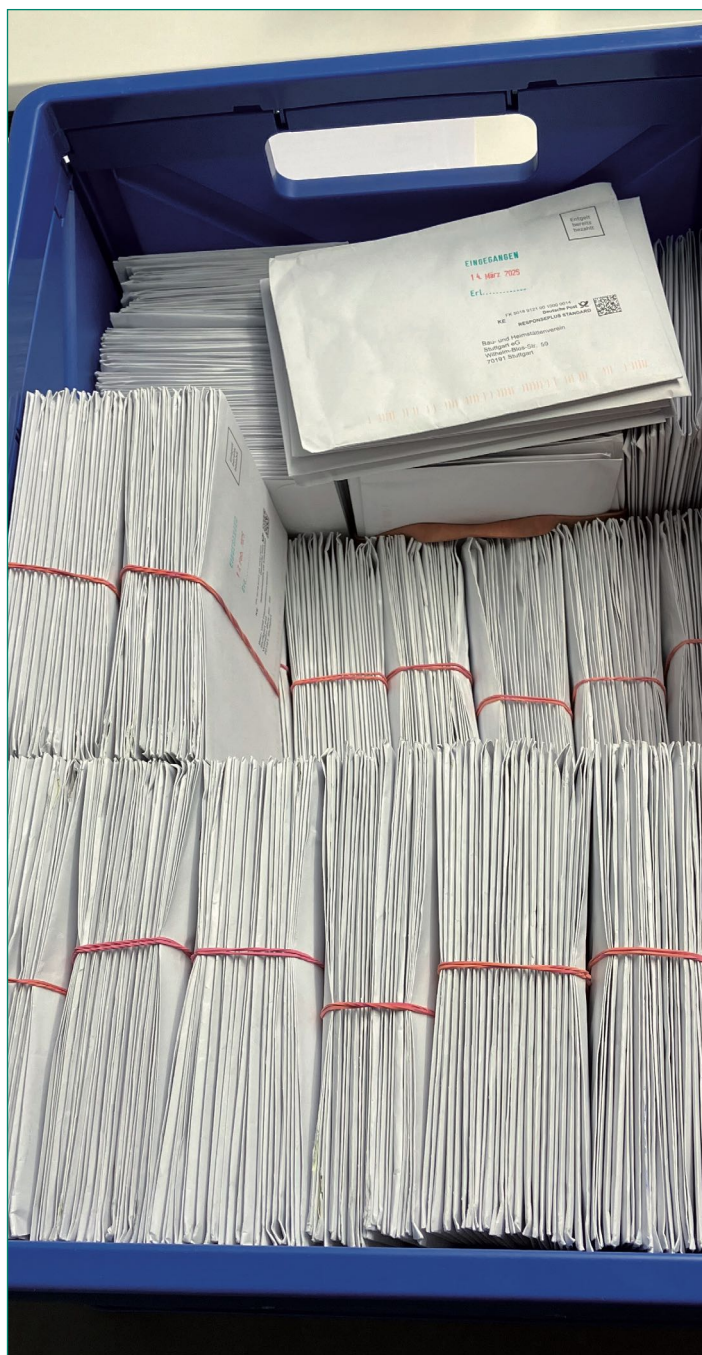
Körbeweise Stimmzettel mussten dokumentiert werden