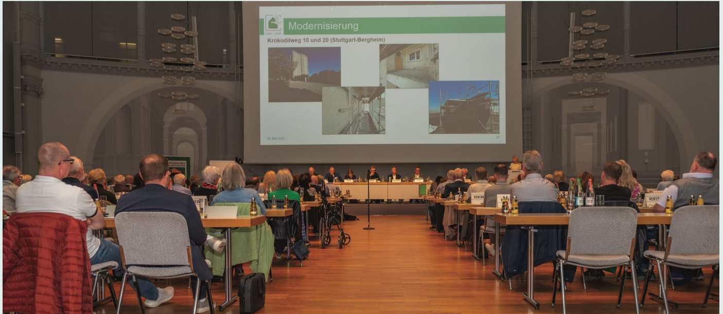
Blick in das Parlament der Genossenschaft bei der 53. Ordentlichen Vertreterversammlung 2025

Die 54. Ordentliche Vertreterversammlung am 18. Mai findet an einem neuen Ort und mit einem neuen, frischen Konzept statt. Doch wie immer gilt: Die Vertreterversammlung ist das höchste beschlussfassende Organ unserer Wohnungsbaugenossenschaft. Deshalb sieht auch dieses Jahr die Tagesordnung wieder Berichte des Vorstandes für das Geschäftsjahr 2025 inklusive der Verwendung des Bilanzgewinns vor, außerdem finden satzungsgemäß die Wahlen zum Aufsichtsrat statt und weitere Anträge aus dem Kreis der Mitglieder können eingereicht werden.