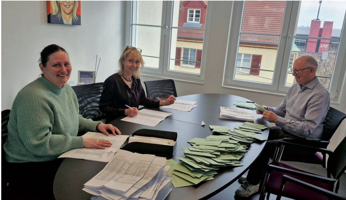
Wahlvorstandsmitglieder beim Auszählen der abgegebenen Stimmen

Vom 6. Februar bis einschließlich 15. März 2026 fanden die Wahlen statt. Insgesamt 79 Mitglieder hatten für die 56 Vertretermandate und die 12 Ersatzvertretermandate kandidiert.