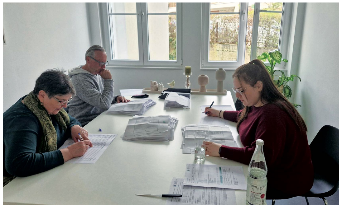
Höchste Konzentration erforderte die Auszählung der abgegebenen Stimmen

Die gewählten Vertreter sind nach Wahlbezirken und den erhaltenen Stimmen absteigend namentlich aufgeführt. Mitglieder können in der Geschäftsstelle auf Anfrage auch die Wahllisten inklusive der Adressen der gewählten Vertreter und Vertreterinnen während der Auslegungsfrist einsehen.